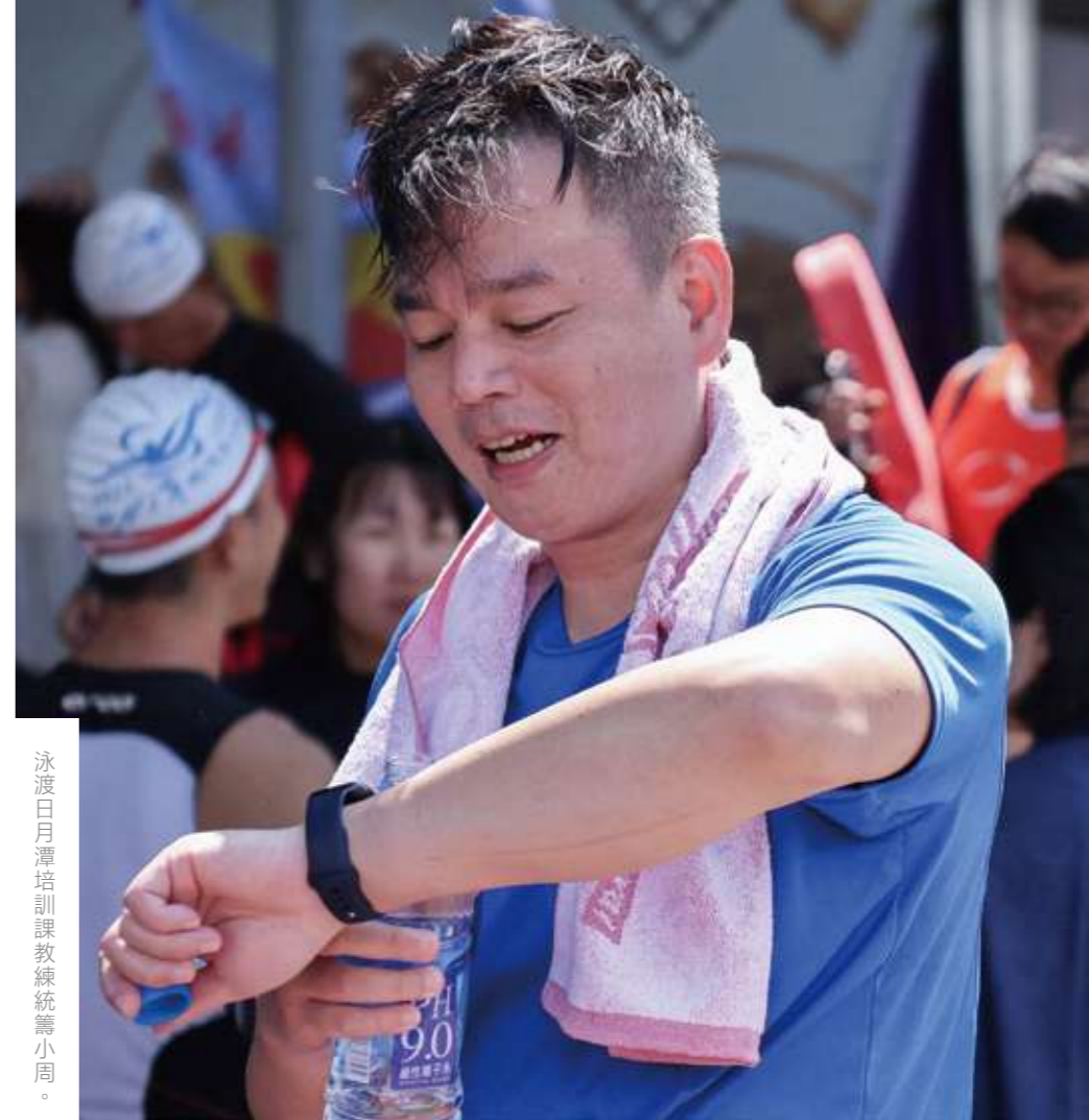
泳渡日月潭培訓課教練統籌小周。

於是，游泳課變成了心理戰，「我和教練團花最多時間思考的，就是怎麼樣校正同事們的動作，讓他們有感於自己的變化。」