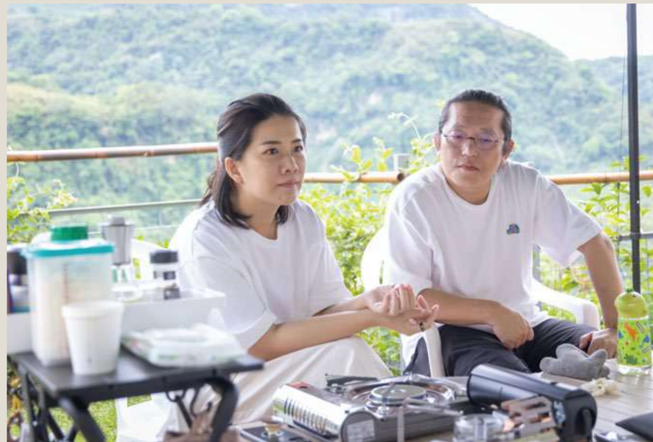
語山簷住戶柯設計師夫婦。